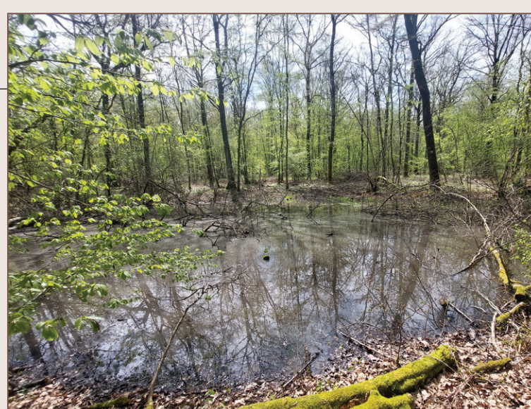
Mare à grenouilles, dans le bois de Tilly