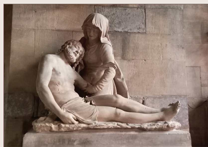
Pietà de l'église Saint-Martin, à Étain

8 Avant le pont, quitter le trottoir pour descendre à droite et cheminer le long de l'Orne. Passer sous le pont de la voie ferrée et aller à gauche pour franchir l'Orne. Après la station d'épuration, continuer dans la rue du Stade, longer le complexe sportif. Prendre à droite sur 20 m dans la rue du 8 e Bataillon de Chasseurs, traverser au passage protégé, reprendre à gauche, puis traverser la voie ferrée. Aller à droite, passer devant la gare et rejoindre le point de départ.