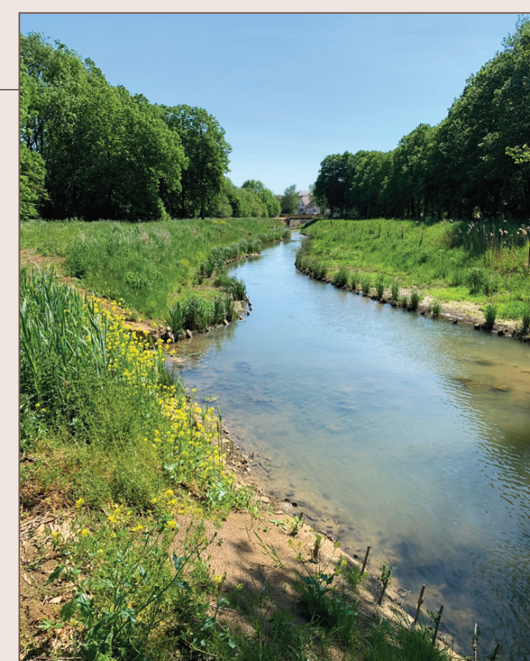
L'Orne à Étain

En 1954, le Conseil Municipal décide de construire une baignade sur son emplacement. Elle connaît d'abord un grand succès, puis sa fréquentation chute. Sa fermeture est définitive en 2012. Décision est prise de restaurer le cours de l'Orne pour qu'elle retrouve ses méandres d'antan avec des rives revégétalisées.